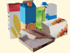
Emballages en carton et briques alimentaires