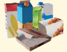
Emballages en carton et briques alimentaires